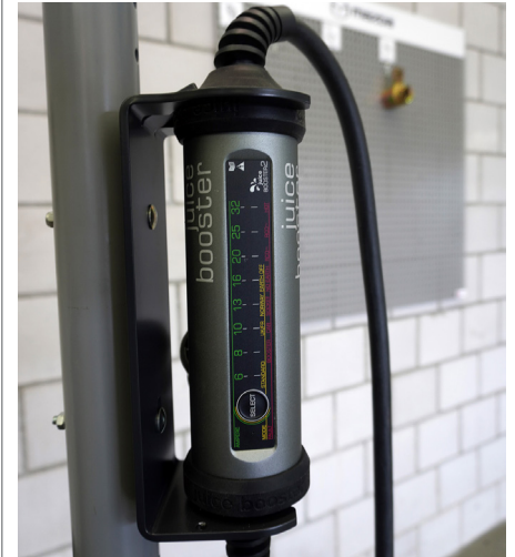
Bild 1: Beim Laden von E-Fahrzeugen werden Transformatoren verwendet, welche mit sinus-förmiger Netzenergie betrieben werden. Das Bild zeigt eine Wallbox aus Schweizer Produktion.

Die Sicherheit vor zu grossen Spannungen wird grundsätzlich grossgeschrieben. Bei jedem Netzgerät ist es wichtig, dass auf der Niederspannungsseite nicht plötzlich die Netzspannung anliegt. Das kann in einem Transformator kaum geschehen, da die beiden Spannungslagen galvanisch getrennt sind. Bei einer galvanischen Trennung wird die zugeführte Energie über eine andere Energieform