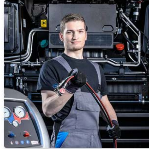
Meccatronico/a d'automobili AFC specializzazione veicoli commerciali