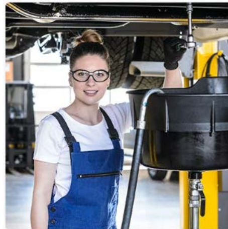
Meccanico/a di manutenzione per automobili AFC specializzazione veicoli commerciali