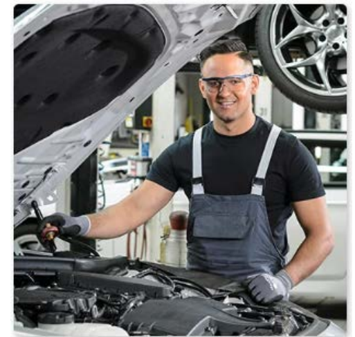
Assistente di manutenzione per automobili CFP