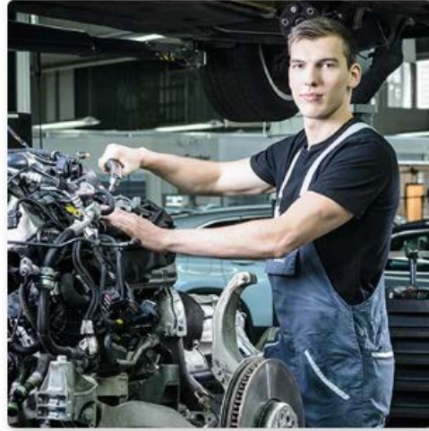
Meccatronico/a d'automobili AFC specializzazione veicoli leggeri