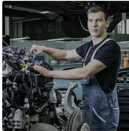
Automobil-Mechatroniker:in EFZ Fachrichtung Personenwagen