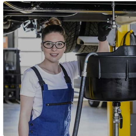
Automobil-Fachmann / Automobil-Fachfrau EFZ Fachrichtung Nutzfahrzeuge