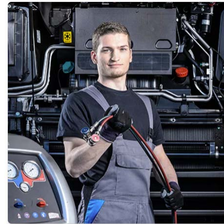
Automobil-Mechatroniker:in EFZ Fachrichtung Nutzfahrzeuge